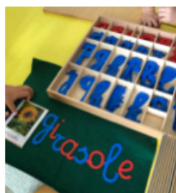
materiali per il linguaggio e la matematica