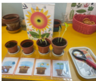
tavolo della natura