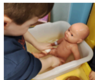
esperienze di vita pratica

Inoltre gli spazi esterni sono organizzati per consentire esperienze di attività motoria, scoperte naturali e la cura dell'orto oltre ad essere considerati come una "sezione all'aperto".